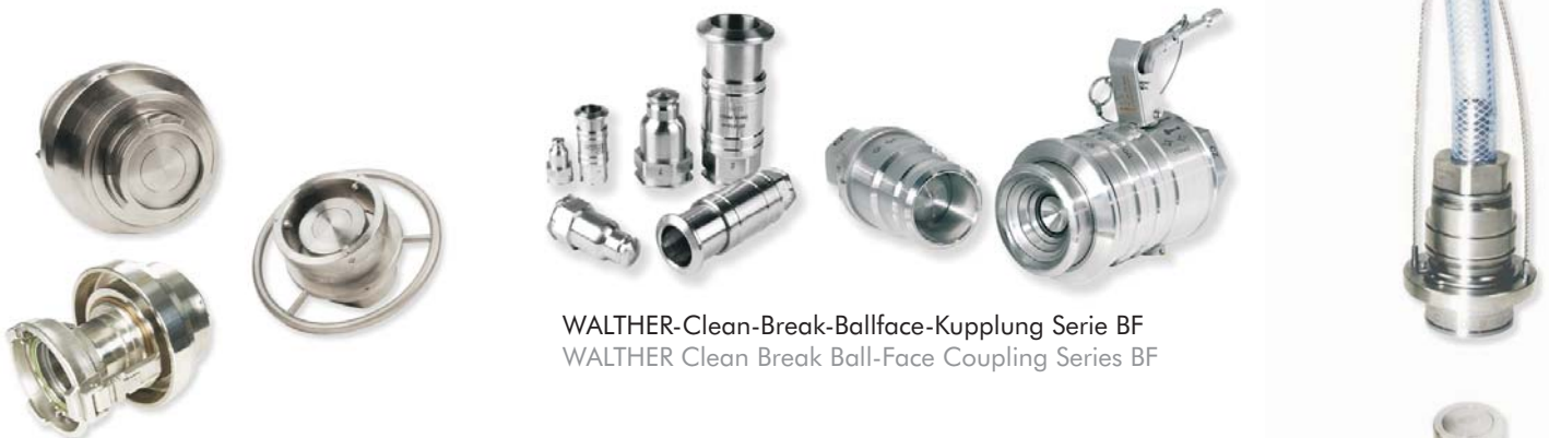
WALTHER-Clean-Break-Ballface-Kupplung Serie BF WALTHER Clean Break Ball-Face Coupling Series BF

WALTHER-Clean-Break-Kupplung, Serie CN mit Norm-Tankwagennippel WALTHER Clean-Break Coupling Series CN with norm-tanker fitting