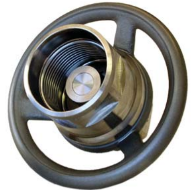
Hochdruck-Kupplungen der Serie HP High pressure couplings series HP